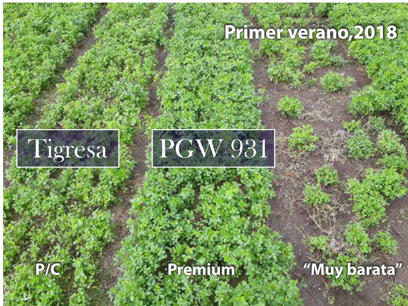
Parcelas de evaluación de producción con PGW 931. Pergamino, febrero 2019.